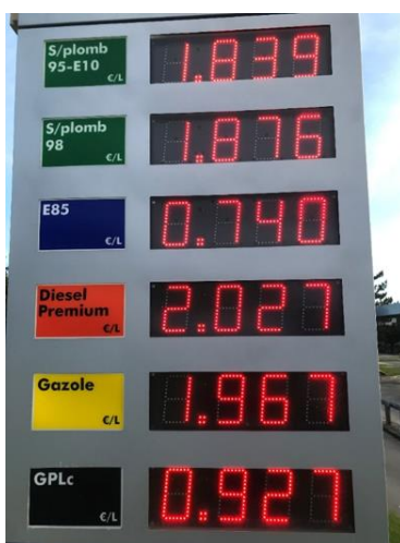
Photo de totem de stations-service le 15/3/2026

Evolution du nombre de vues de la page Facebook de la Communauté Superéthanol-E85 depuis le 27/2/2026