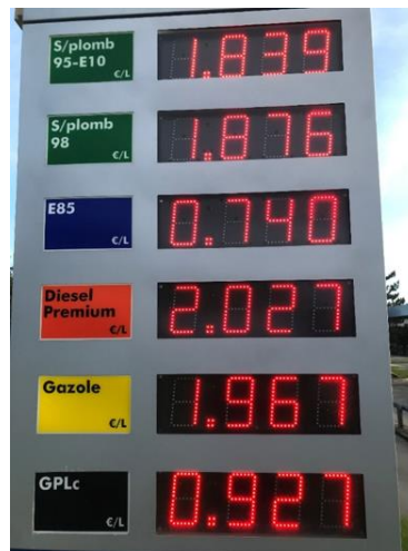
Photo de totem de stations-service le 15/03/2026

Evolution du nombre de vues de la page Facebook de la Communauté Superéthanol-E85 depuis le 27/2/2026