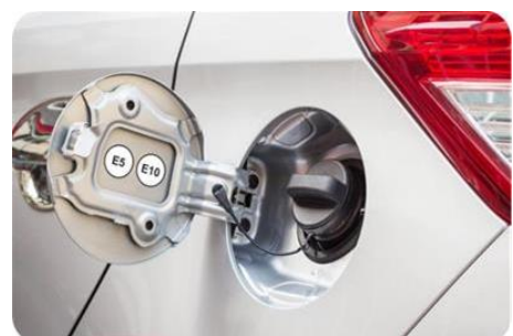
Trappe à carburant d'une voiture essence

Le SP95-E10 représente déjà la première essence de France avec 43 % du marché des essences . Il est proposé dans 2/3 des stations-services . Les automobilistes ont tout intérêt à le demander dans les stations qui ne le proposent pas encore.